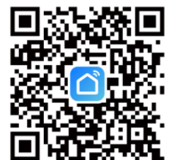
Smart Life App